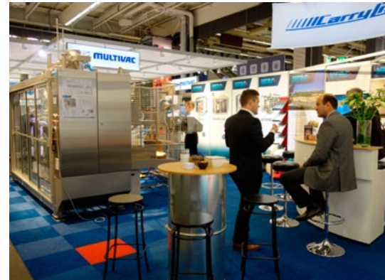
Vebe Teknik finns i monter B04:40.

– Mångsidigheten hos Autopac är vi väldigt stolta över. Vi gillar utmaningen att tillsammans med en kund pussla ihop den optimala lösningen för just deras behov. ■